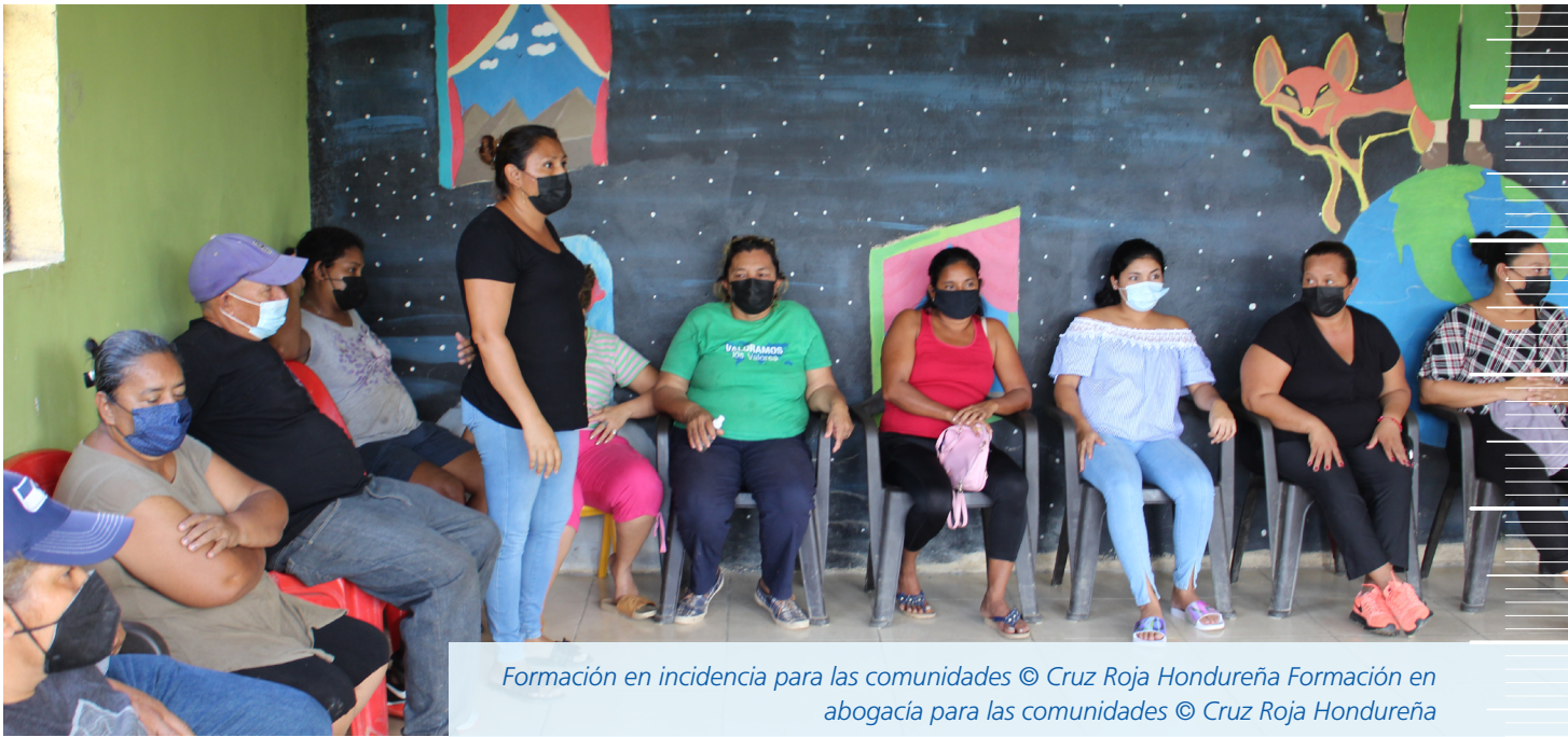
Formación en incidencia para las comunidades © Cruz Roja Hondureña Formación en abogacía para las comunidades © Cruz Roja Hondureña

pertenencia al grupo de trabajo de la Ley Internacional de Respuesta a Desastres.